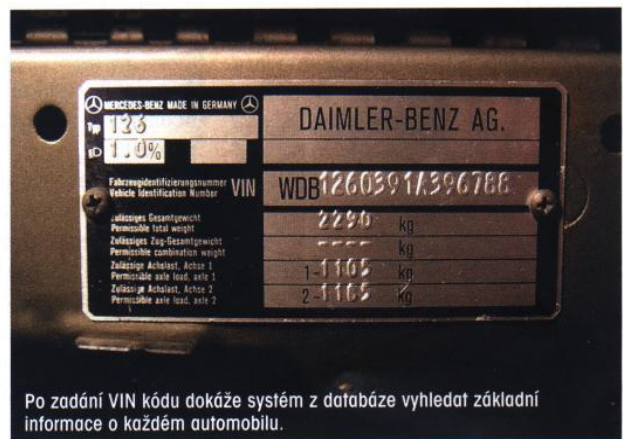
Po zadání VIN kódu dokáže systém z databáze vyhledat základní informace o každém automobilu.

Cebia v současné době jedná o získání přístupu do servisních záznamů jednotlivých evropských automobilek, v současnosti již má