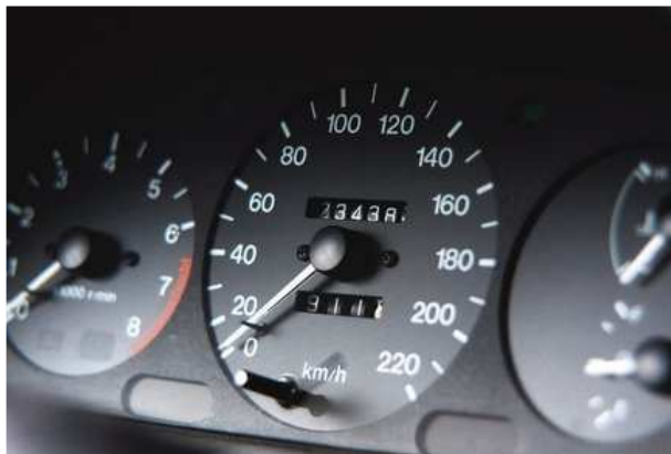
Podvodníků, kteří se snaží obohatit z vaší kapsy stále přibývá.